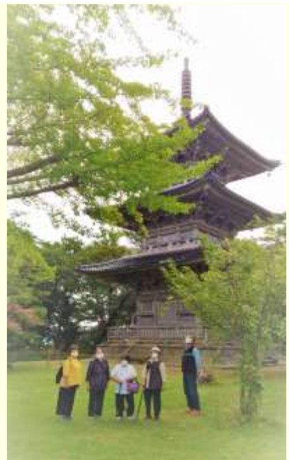
五智国分寺の三重の塔の前にて

五智国分寺、春日山神社や道の駅あらいなどを巡り散歩やお買い物など盛りだくさんの一日を過ごしました。参加者の皆様も楽しんでいただけよう、浦川原に到着すると「あ～着いちゃった」と少し寂しそうなのが印象的でした。